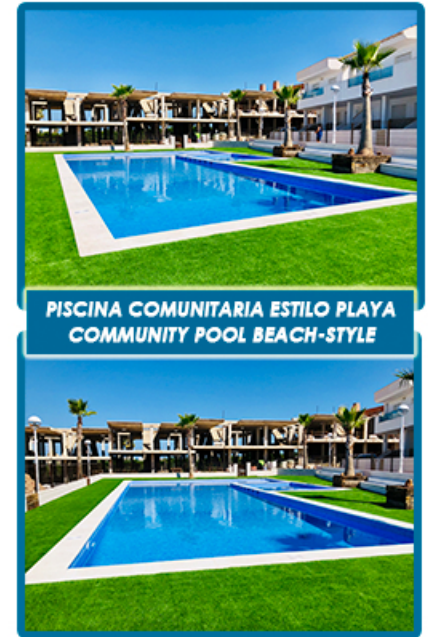
PISCINA COMUNITARIA ESTILO PLAYA COMMUNITY POOL BEACH-STYLE

VISTAS AL MAR Y A LA LAGUNA GREAT VIEWS TO THE SEA & LA LAGUNA