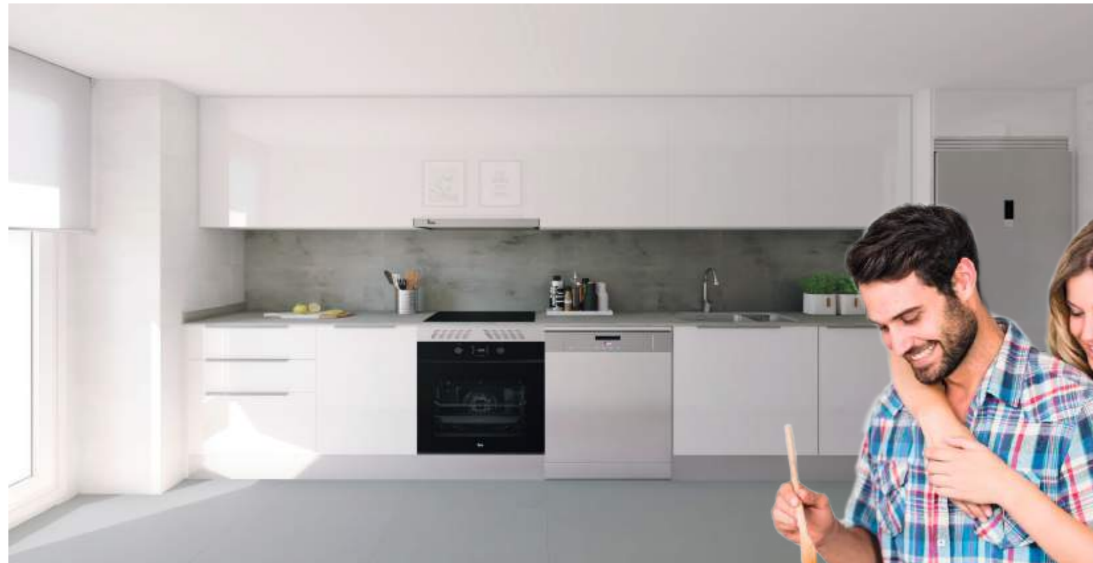
Cocinas prácticas y modernas amuebladas con electrodomésticos y concebidas para hacer más fácil las tareas diarias.