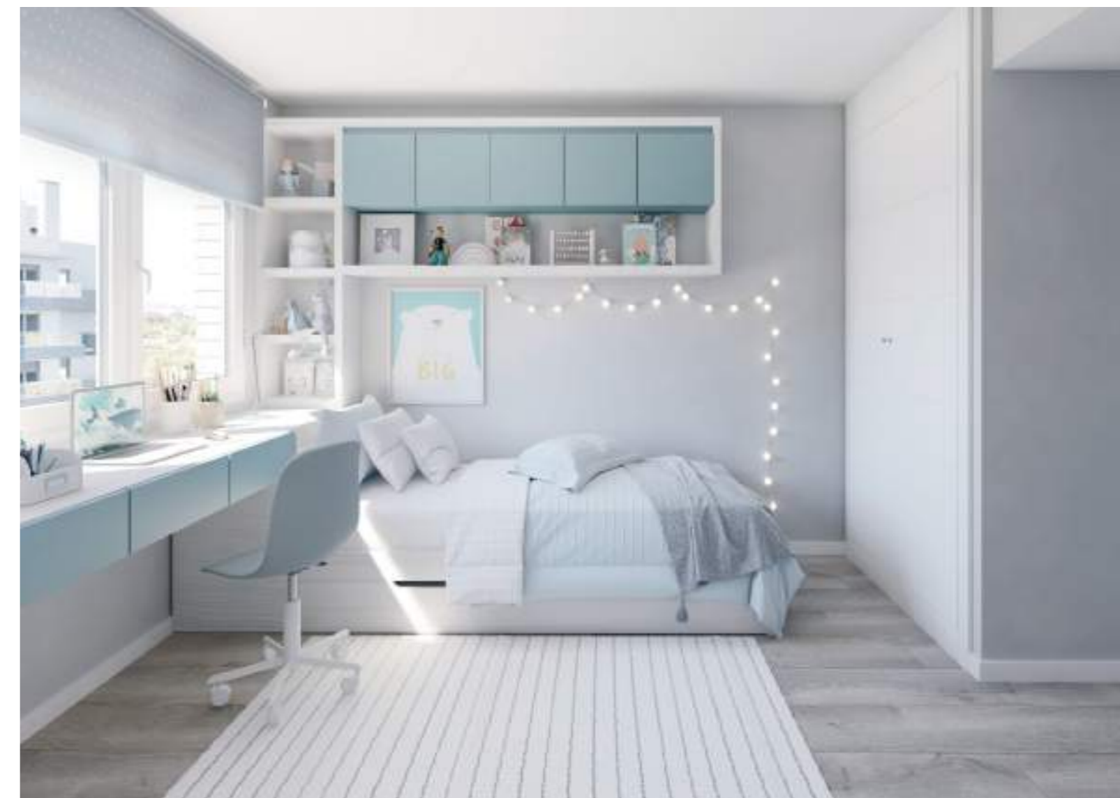
Dormitorios secundarios cómodos y funcionales donde los más pequeños también disfrutarán de su espacio privado.