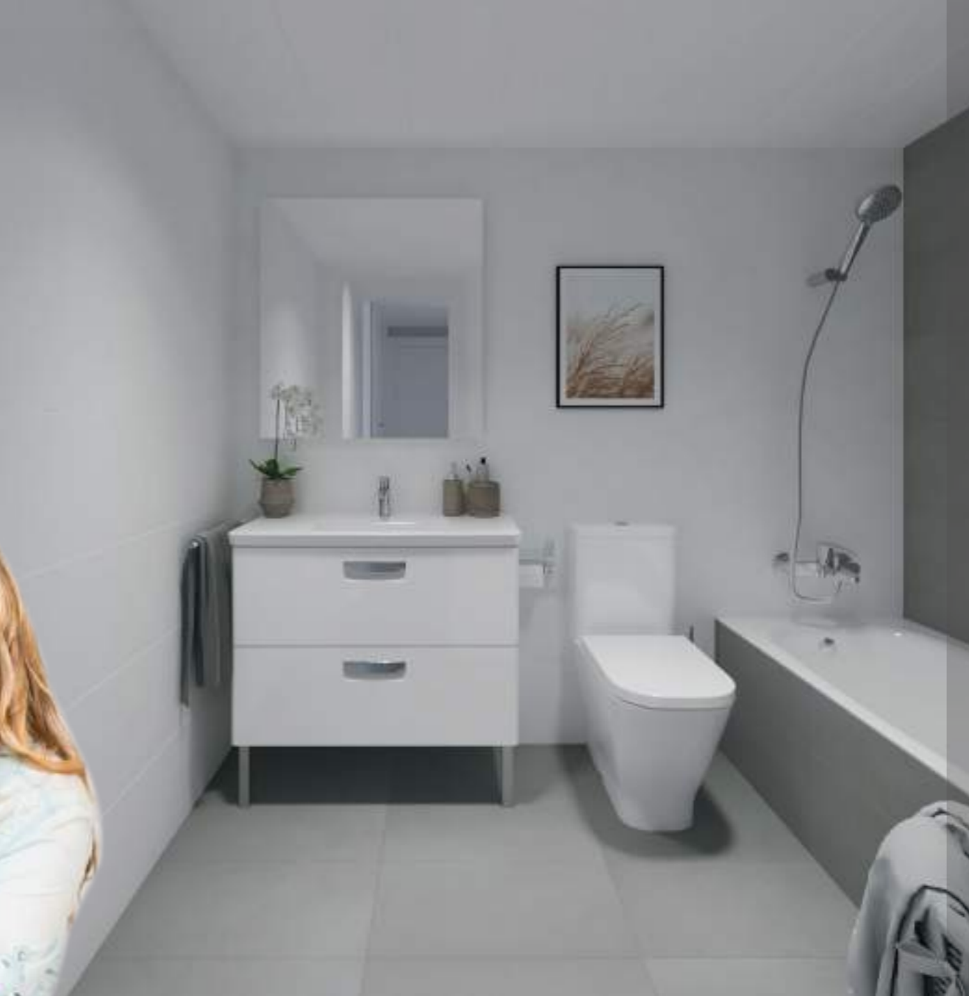
Cuartos de baño con materiales de primera calidad en suelos, alicatados y sanitarios.