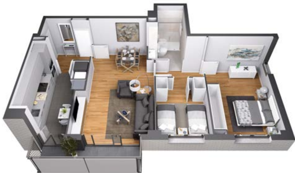
◆ Vivienda tipo 2 dormitorios.