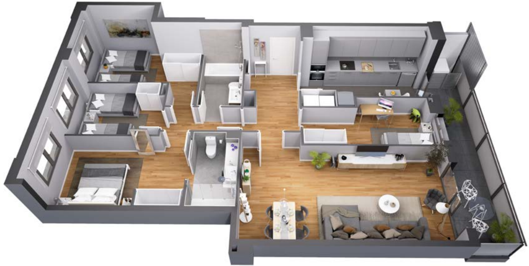
◆ Vivienda tipo 4 dormitorios.