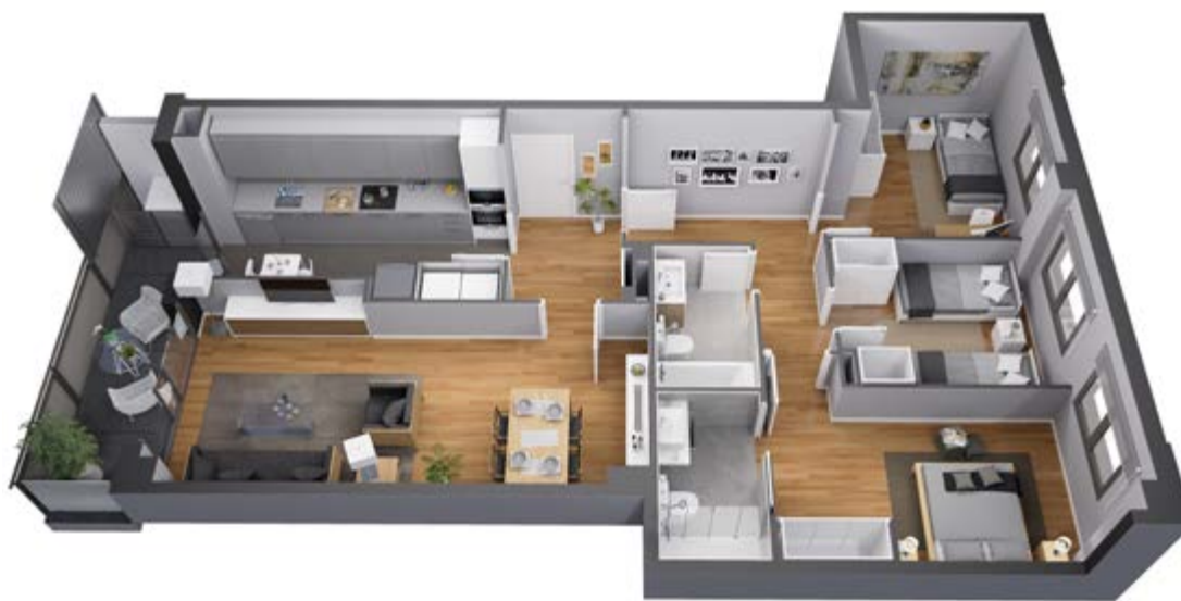
◆ Vivienda tipo 3 dormitorios.