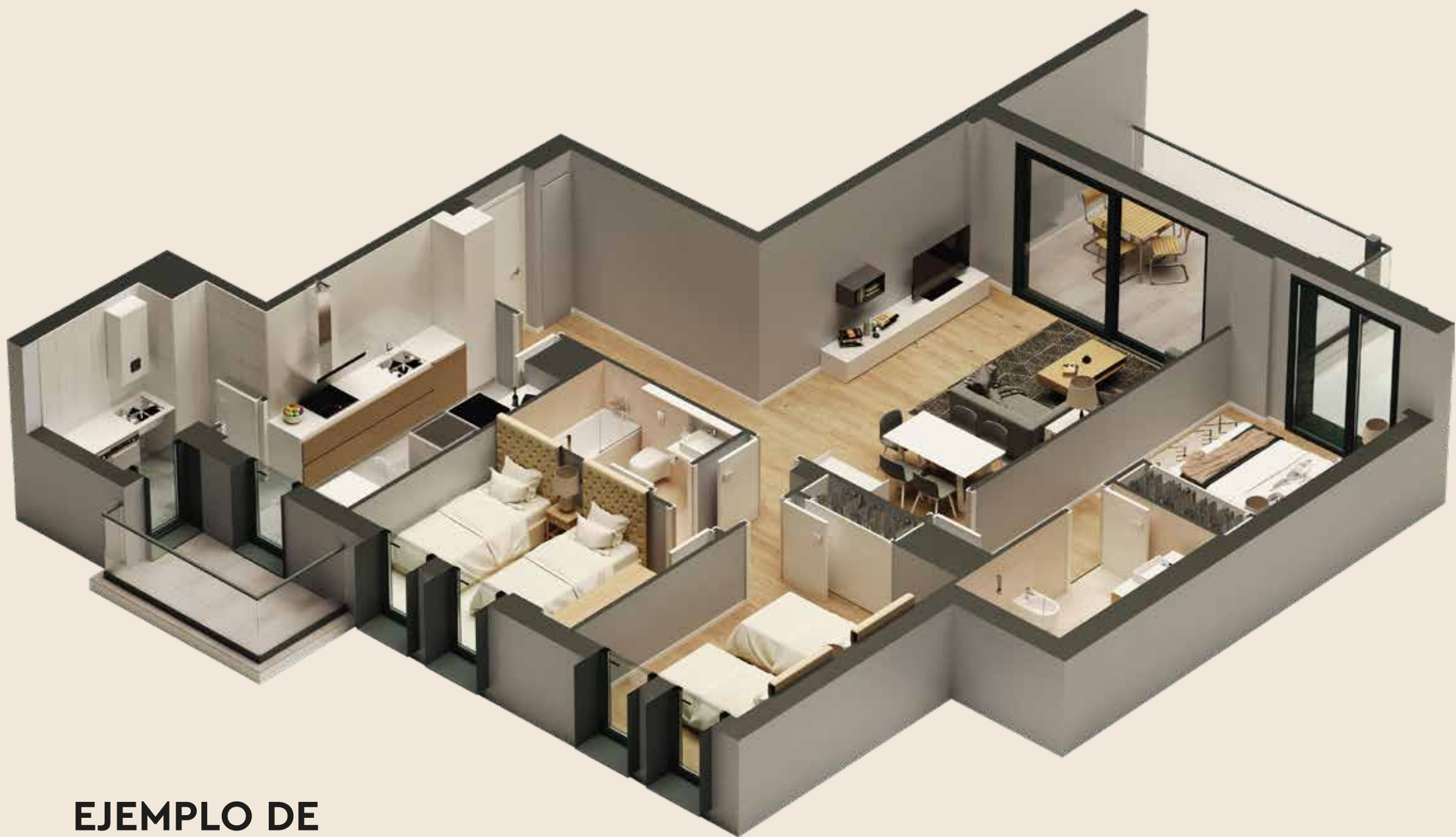
EJEMPLO DE 3 DORMITORIOS