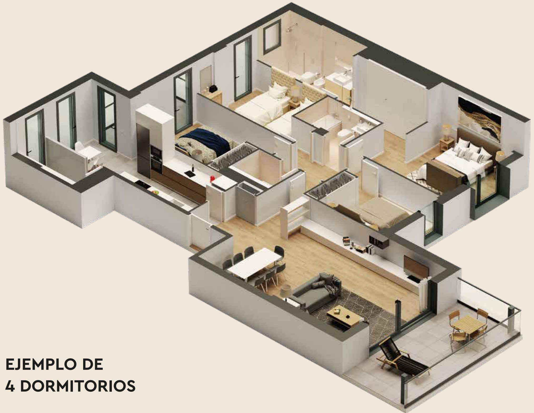
EJEMPLO DE 4 DORMITORIOS