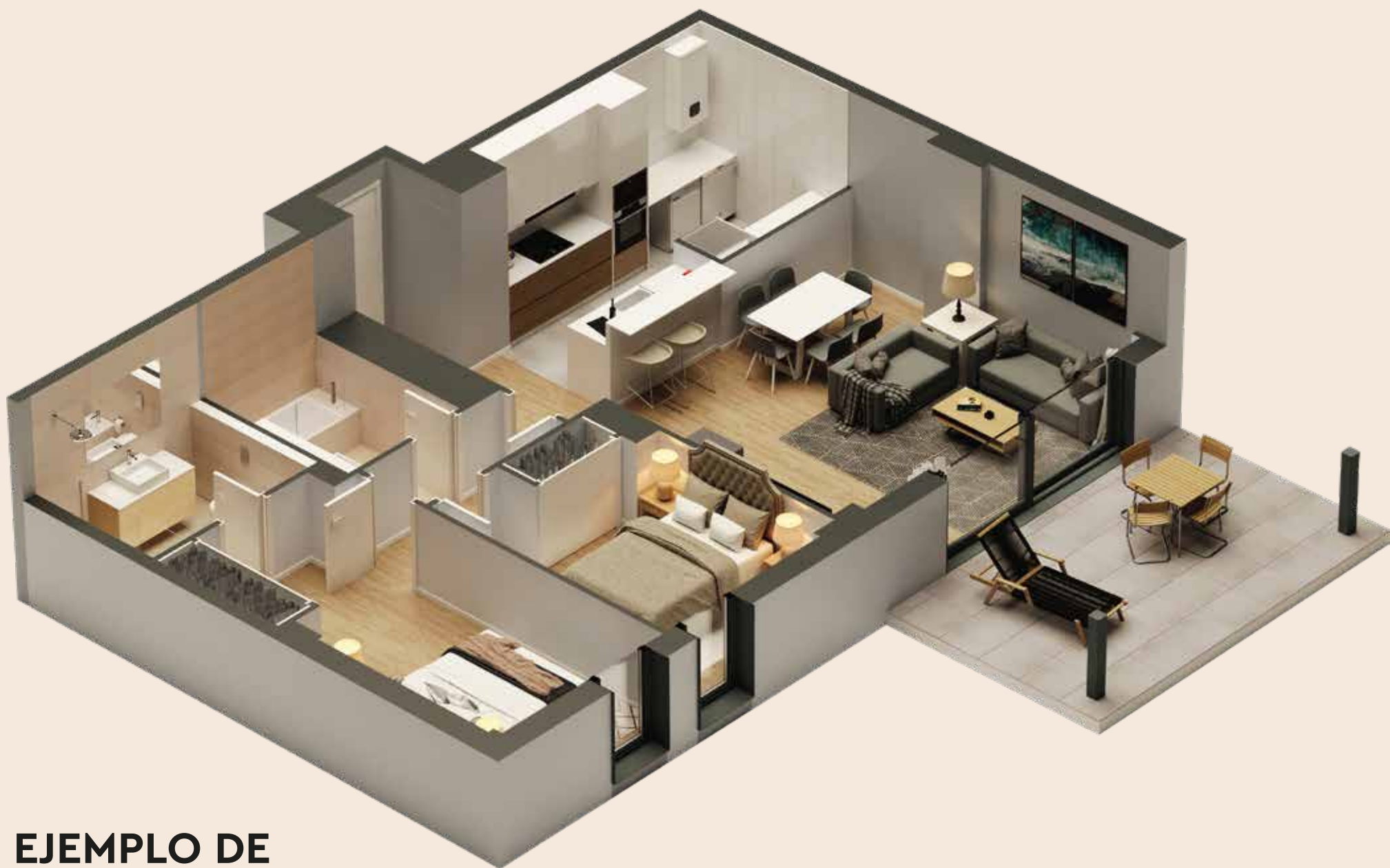
EJEMPLO DE 2 DORMITORIOS