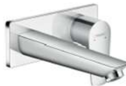
Grifería empotrada modelo Talis E Hansgrohe Built-in tap. Talis E Hansgrohe