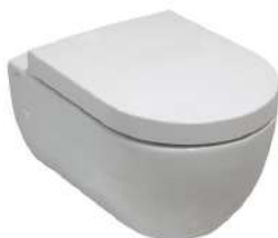
Sanitario suspendido de Arquitect de Noken PORCELANOSA con pulsador integrado en la pared. Suspended wall-mounted Arquitect by Noken PORCELANOSA with the push button integrated into the wall.