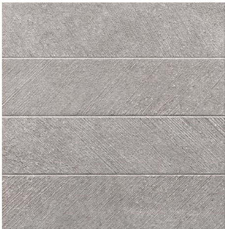
Gres Porcelánico colección Bottega modelo Spiga color Acero Porcelainic tile, Bottega collection, steel color by Porcelanosa