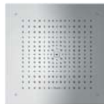
Rociador empotrado Raindance E Hansgrohe Built-in shower Raindance E Hansgrohe