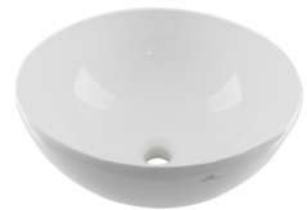
Lavabo redondo blanco modelo LOUNGE de PORCELANOSA Round wash basin type LOUNGE by PORCELANOSA .