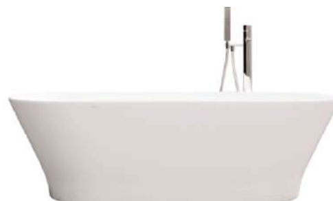
Bañera independiente Krion (Slim model, 150 x 80 cm) freestanding bathtub by Krion (Slim model, 150 x 80 cm)