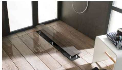
Showerdeck de Butech Showerdeck by Butech