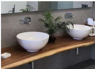
Encimera de madera tropical y lavabos redondos modelo Lounge Tropical Wood sink counter with round wash basin, Type Lounge